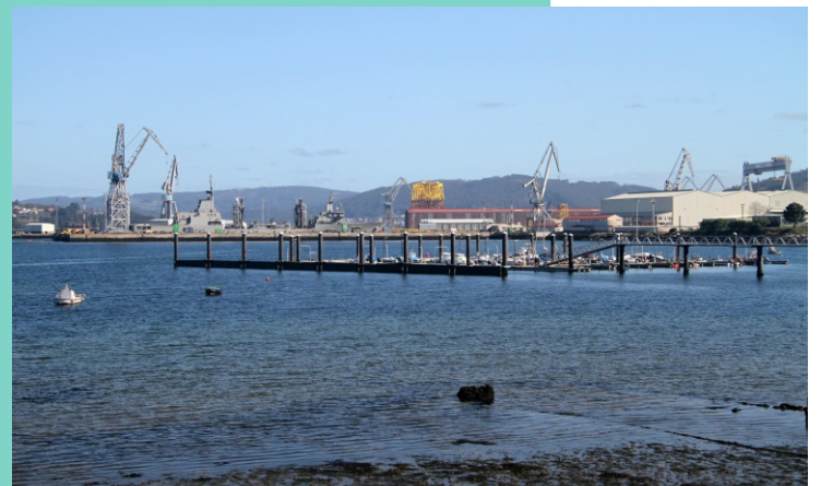
5-Porto de Barallobre