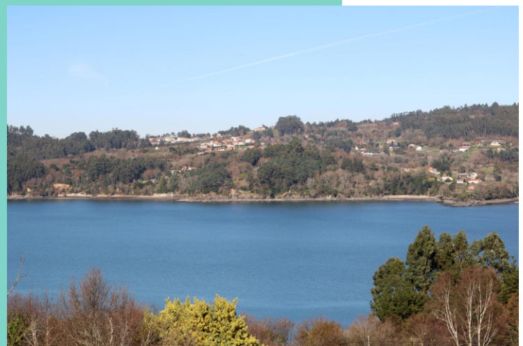
Costa entre O Coído e Almeiras