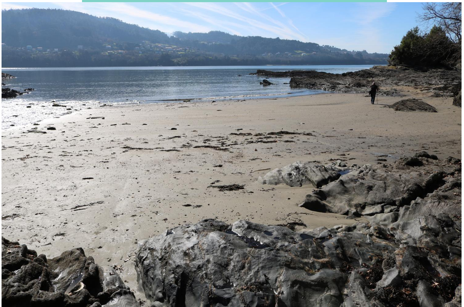
11-Desembocadura do rio Castro e praia