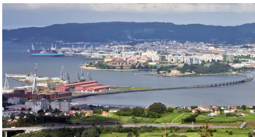
2-Punta e ponte das Pías