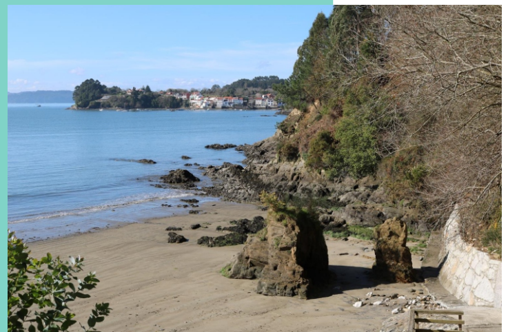
8-Praia do Coido