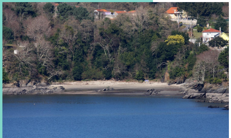
9-Praia de Almeiras