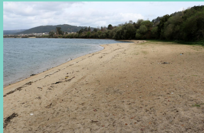
Praia de San Valentín