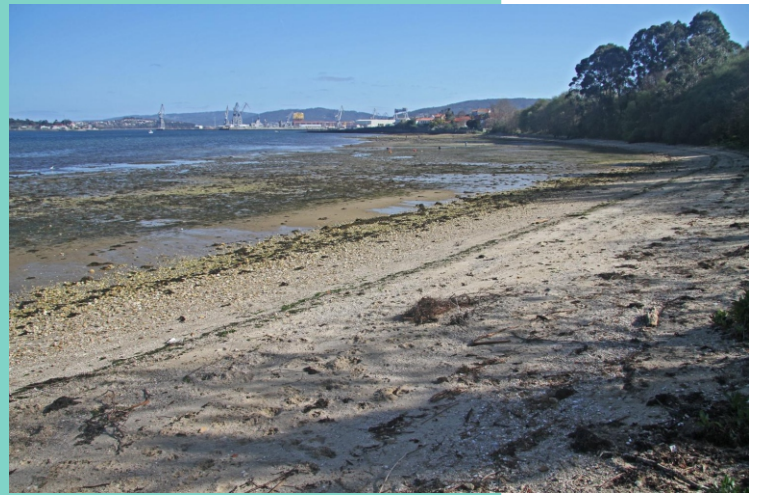
Praia de Maniños