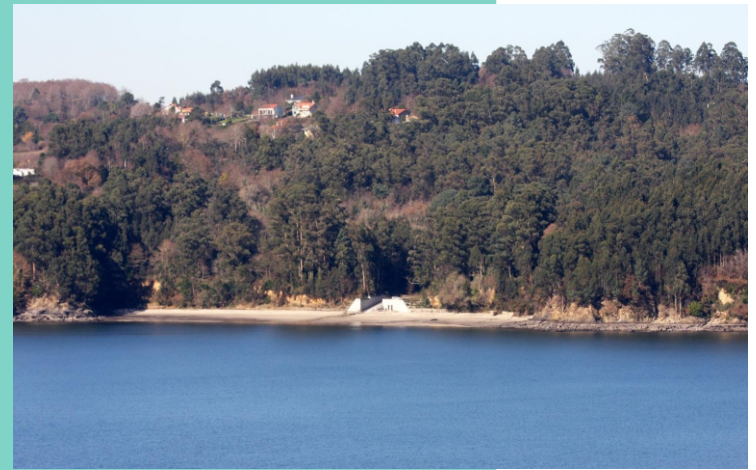
7-Praia do río Sandeu