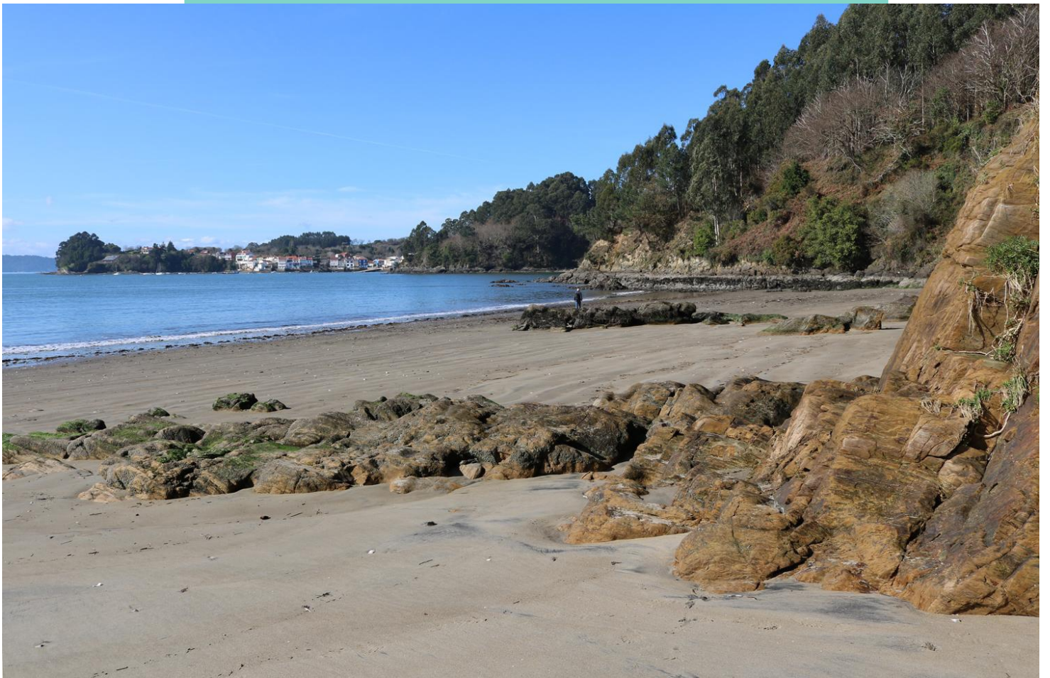
Praia do Coído