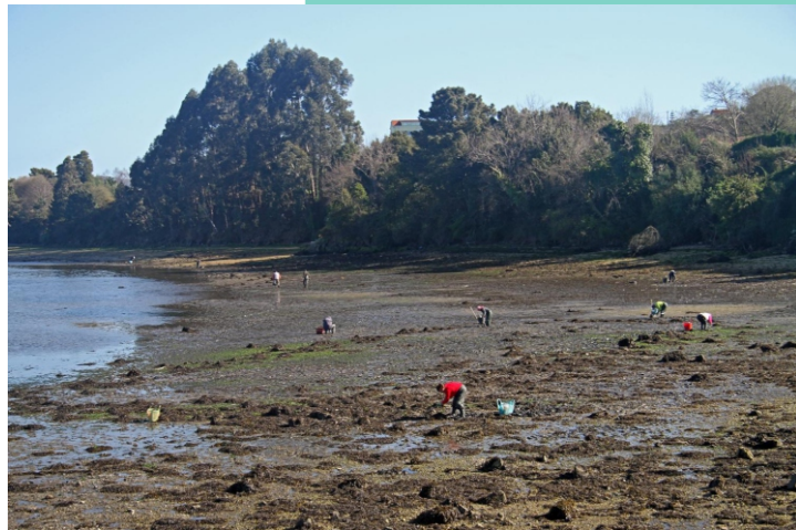
4-Praia do Carril