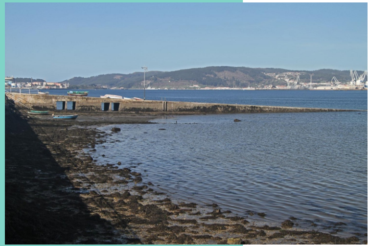
6-Porto de Maniños